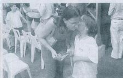
Aluno apresenta a mãe com o CD "Canto de Natal"

Alunos da educação infantil e ensino fundamental do COC encerraram na última sexta-feira o ano letivo, cantando músicas natalinas para pais e convidados na unidade Morumbi.