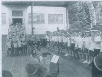
Apresentação dos alunos da educação infantil