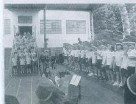
Apresentação dos alunos da educação infantil