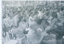
Pais e convidados aplaudem apresentação do coro de alunos