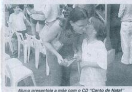
Aluno apresenta a mãe com o CD "Canto de Natal"

Alunos da educação infantil e ensino fundamental do COC encerraram na última sexta-feira o ano letivo, cantando músicas natalinas para pais e convidados na unidade Morumbi.