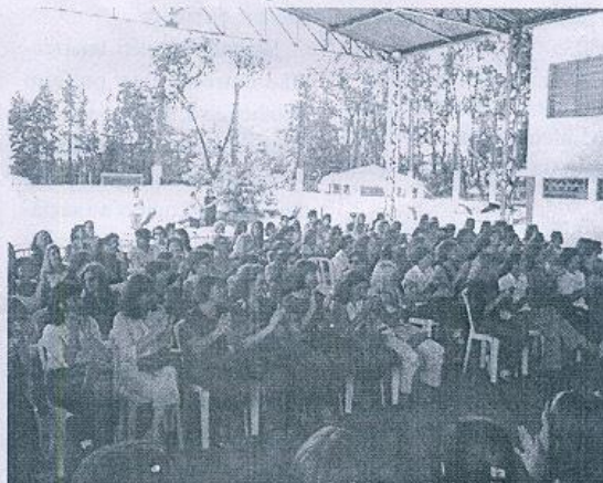
Mães aplaudem apresentações musicais