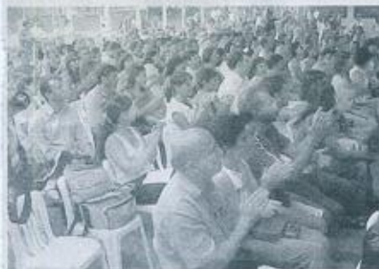
Pais e convidados aplaudem apresentação do coro de alunos